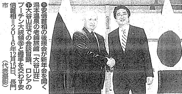
●安倍首相の後援会が新年会を開く湯本温泉の老舗旅館「大谷山荘」 ●大谷山荘での会談冒頭、ロシアのプーチン大統領(左)と握手を交わす安倍首相(2016年12月15日、長門市)