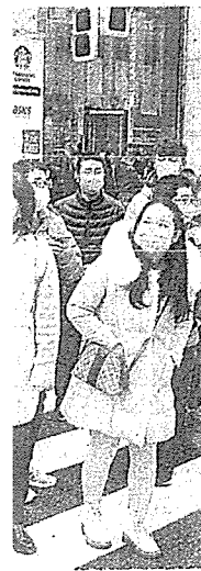
新型肺炎の感染拡大が懸念される中、マスク姿で東京・銀座を訪れた中国からの団体旅行者 (26日午後)

が、食事は刺し身や揚げ物など簡単なオードブルと話す支援者の一方、ある旅館関係者は取材に「総理は地元の誇り。旅館側も赤字覚悟で頑張っているはずだ」と指摘する。